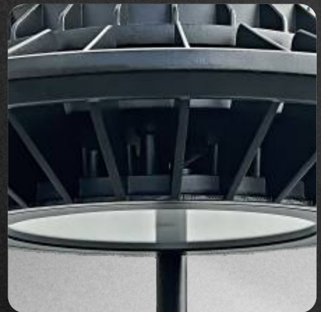
Difusor de acrílico policarbonato