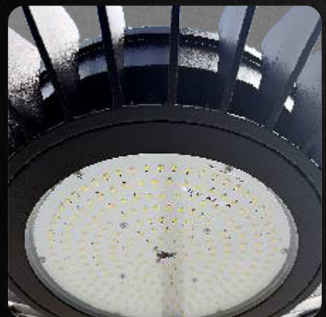
Garantía de 5 años