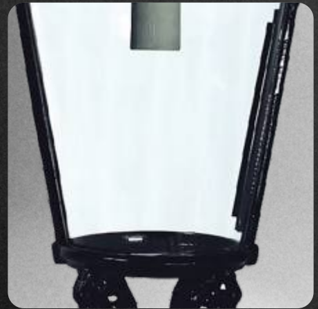
Difusor de acrílico transparente