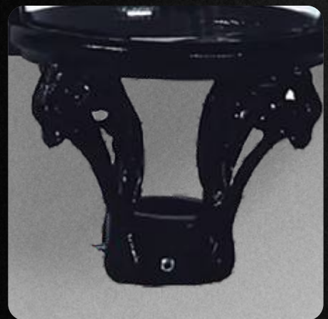
Garantía de 3 años