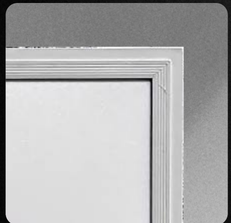
Garantía de 3 años