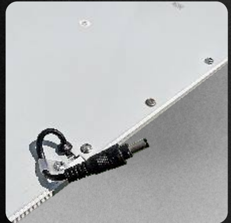
Voltaje desde 85 a 265V