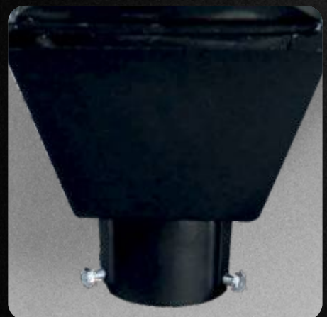
Garantía de 3 años