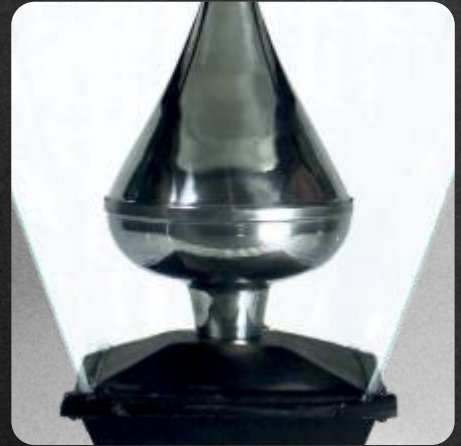
Difusor de cristal termotemplado