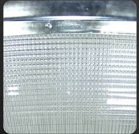
Difusor de acrílico policarbonato