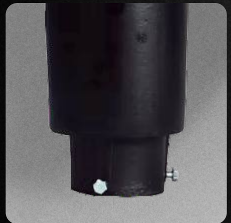
Garantía de 3 años