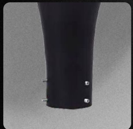
Garantía de 3 años