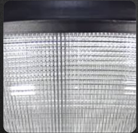
Difusor de acrílico policarbonato