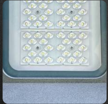
Difusor de acrílico policarbonato