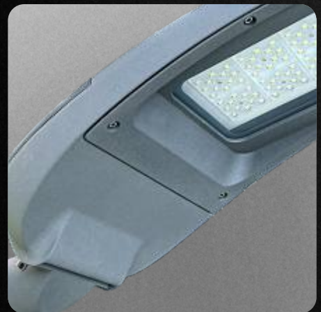
Garantía de 10 años