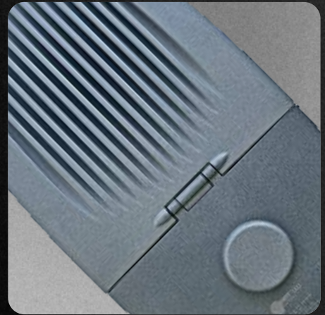
Carcasa en inyección de aluminio