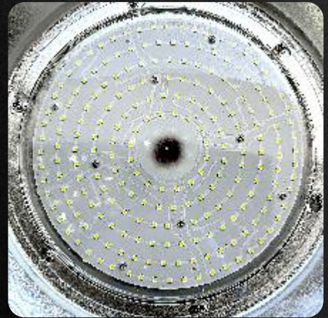
Led SMD Epistar