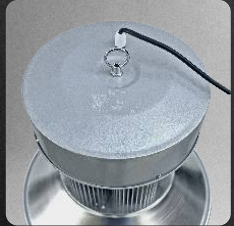
Carcasa en inyección de aluminio