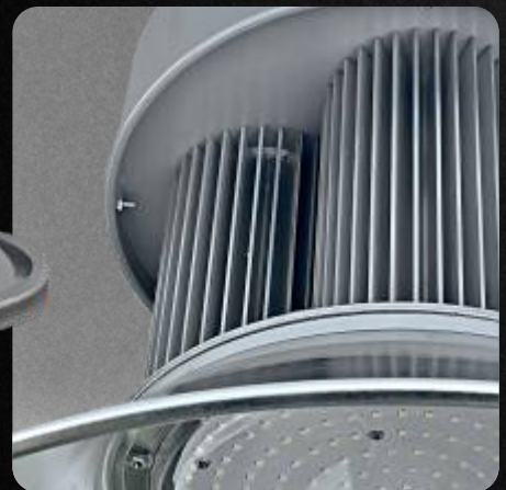
Garantía de 3 años