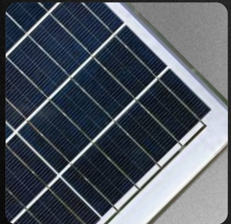
Panel solar independiente