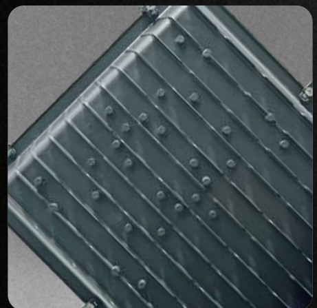
Garantía de 3 años