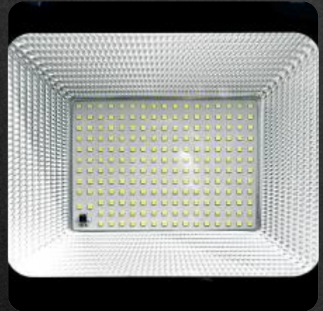
Difusor de cristal termotemplado