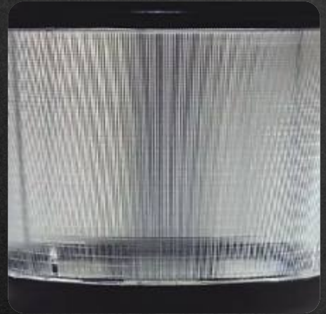
Difusor de acrílico policarbonato