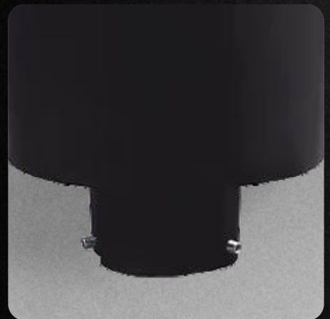
Garantía de 3 años